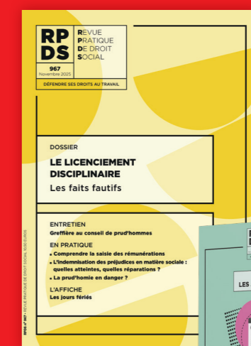
NOUVELLE FORMULE RPDS, LA REVUE PRATIQUE DE DROIT SOCIAL POUR DÉFENDRE SES DROITS AU TRAVAIL Prix unitaire : 10,50 € Abonnement : 120 €/an