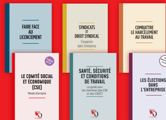
LES GUIDES VO ÉDITIONS format poche à partir de 12 €