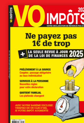
LE HORS SÉRIE POUR DÉCLARER SES RÉVENUS Prix unitaire : 7,20 €