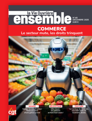
LE MAGAZINE MENSUEL DES ADHÉRENTS CGT