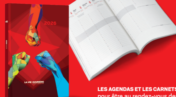
LES AGENDAS ET LES CARNETS DE NOTES pour être au rendez-vous des luttes.

COMMANDES ET ABONNEMENTS SUR NVOBOUTIQUE.FR