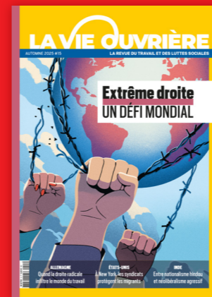
LE TRIMESTRIEL DU TRAVAIL ET DES LUTTES SOCIALES Prix unitaire : 9,50 € Abonnement : 60 €/an